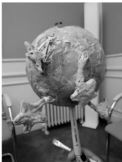
Figuur 3 De kraal van de sprankels